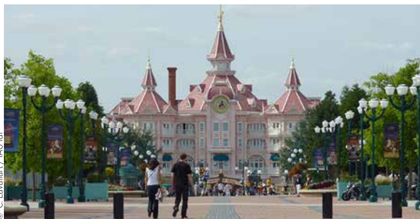
Disneyland Paris, un site touristique majeur en Europe