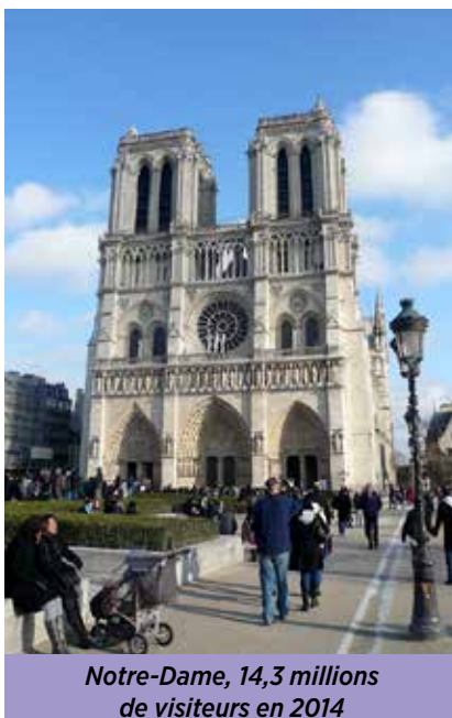
Notre-Dame, 14,3 millions de visiteurs en 2014