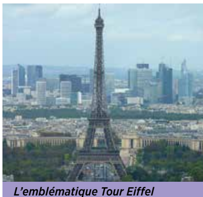
L'emblématique Tour Eiffel

Pour remédier à cela, le gouvernement a ainsi présenté un véritable plan de bataille. Avec un objectif prioritaire : l'amélioration de l'accueil des touristes. Une série de mesures concrètes a d'ores et déjà été décidée : délivrance de visas en moins de 48h pour les touristes chinois et indiens notamment, renforcement des points d'information dans les aéroports et les gares, etc. L'accent a par ailleurs été mis sur le développement des technologies numériques avec par exemple la mise en place, avant l'Euro 2016 de football, d'un « citypass » dématérialisé pour avoir accès aux transports et à certains musées. Le projet du gouvernement prévoit aussi de donner davantage d'importance à la formation des professionnels du tourisme et instaure un fonds d'investissement pour le tourisme (via la Caisse des dépôts) en même temps qu'il débloque une