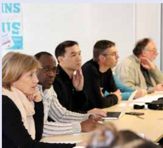
Première rencontre des mandatés CDCA - 7 mars

Adoptée en 2015, la Loi d'adaptation de la société au vieillissement a mis en place les Conseils départementaux de la citoyenneté et de l'autonomie (CDCA), compétents en matière de prévention de la perte d'autonomie (personnes âgées et personnes en situation de handicap), d'accompagnement médico-social et d'accès aux soins et aux aides humaines et techniques.