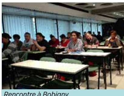
Rencontre à Bobigny