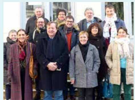
12 des 15 membres de la délégation CFDT