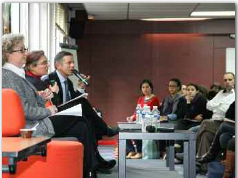
Rencontre du 3 décembre 2013 sur les outils d'Action logement

Si les organisations syndicales – CFDT en tête – se félicitent dans un communiqué commun que l'ensemble des locataires dont le montant du loyer n'excède pas 50 % y soient éligibles, ils déplorent toutefois que « certaines mesures [...], qui allaient pourtant dans le bon sens, ne soient pas retenues : le caractère obligatoire de la GUL et la suppression de la caution ». Pour rappel, la CFDT proposait plusieurs améliorations du texte comme la participation des bailleurs au financement de la GUL (qui sera finalement assuré par le fonds d'Action Logement et l'État), la mise en place d'un accompagnement adapté aux situations des locataires, ou encore la représentation plus significative des partenaires sociaux d'Action logement dans la gouvernance de l'établissement public (AGUL). □