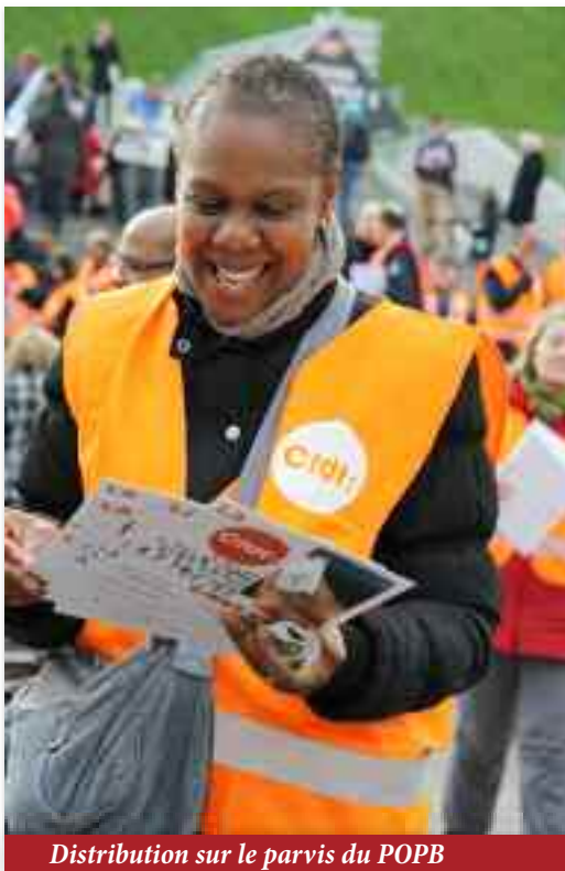
Distribution sur le parvis du POPB

Les 13 et 14 janvier, à l'occasion des traditionnels vœux du maire, la CFDT Interco Paris (services publics parisiens) a lancé tambours battants sa campagne pour les élections professionnelles de fin d'année. Reportage.