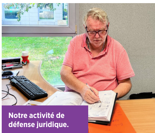
Notre activité de défense juridique.

L'activité juridique représente un axe essentiel pour l'UTI recevant environ 2 500 salariés durant les 4 années d'activité.