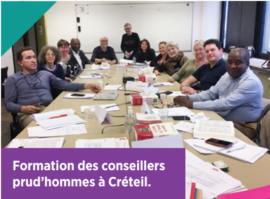
Formation des conseillers prud'hommes à Créteil.