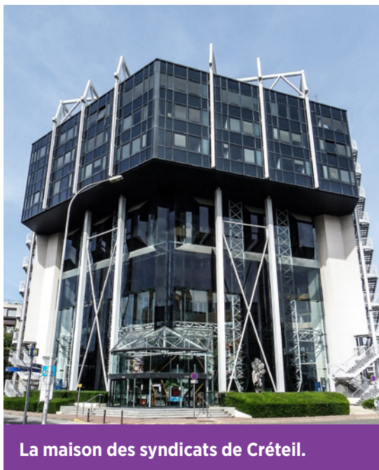
La maison des syndicats de Créteil.

L'activité de l'UTI CFDT Sud Francilien, s'est fondée sur une collaboration étroite et efficace entre les assistants administratifs, l'exécutif. Cette synergie a permis d'assurer la continuité, la réactivité et la qualité du service rendu aux salariés, aux syndicats et aux militants.